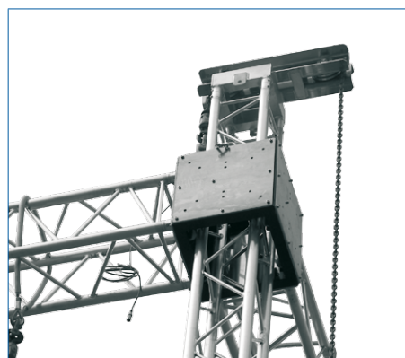
Chariot acier / aluminium renforcé