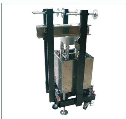
Ensemble optimisé pour le transport