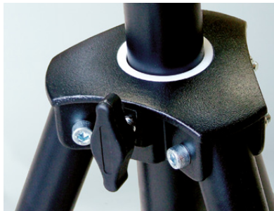
Chariot en aluminium coulé avec molette de serrage sur cale polyamide et bague téflon