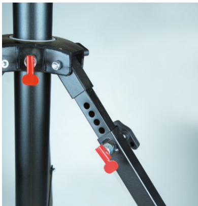
Patte réglable pour terrain accidenté