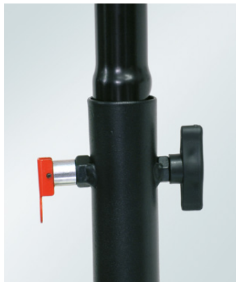
Molette de rattrapage de jeu et mât embouti pour un guidage parfait et goupille de sécurité