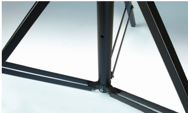
Pattes à double traverse