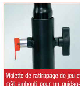
Molette de rattrapage de jeu et mât embouti pour un guidage parfait et goupille de sécurité