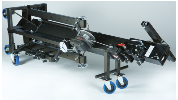
Position transport couchée