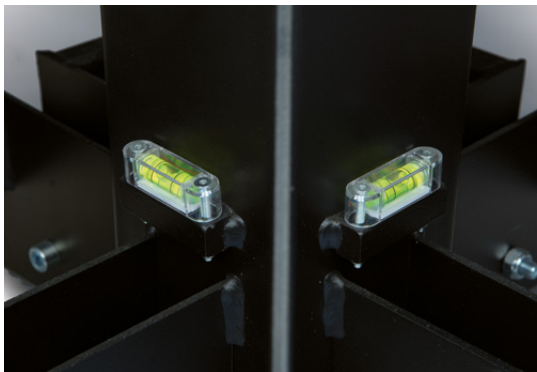
2 niveaux à bulle pour mise à l'aplomb