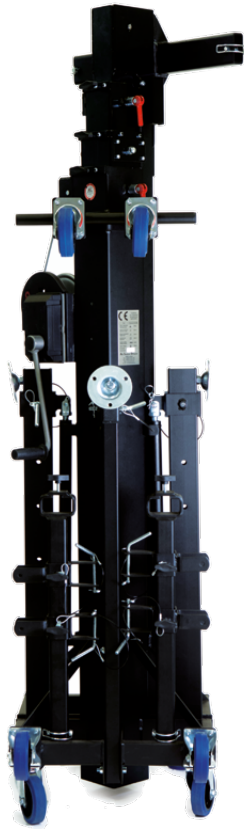
Position repliée (transport vertical)