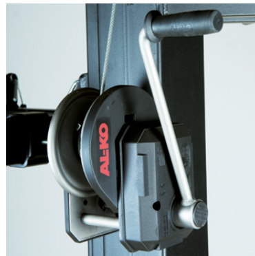
Treuil anti-retour freiné